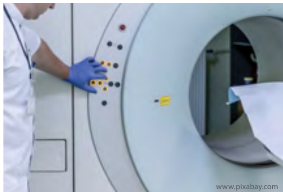
16 Zmiany w obrębie prostaty widoczne w obrazowaniu rezonansem magnetycznym