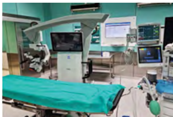
41 Zintegrowany system sal operacyjnych – optymalizacja procesu zabiegu